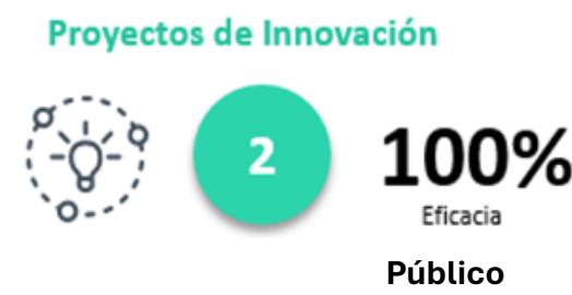
Figura 3. Eficacia del portafolio de proyectos