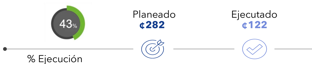
Figura 12. Ejecución Presupuestaria al 30 de junio 2025 (millones)

La ejecución presupuestaria 2025 de la Auditoría Interna al primer semestre del 2025 es del 43%, producto del pago de planilla, los gastos e inversiones realizadas, como lo detalla la siguiente figura.