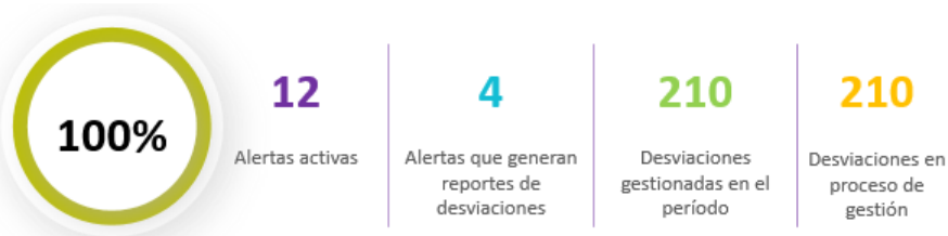
Figura 4. Detalle de Alertas activas en el primer semestre 2025