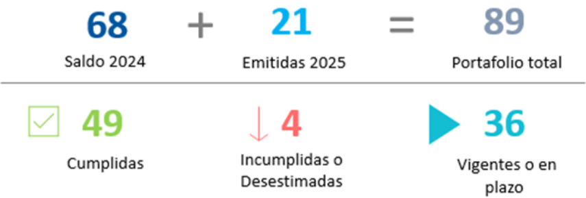
Figura 8. Portafolio de Recomendaciones

La Auditoría Interna comunica 21 recomendaciones emitidas durante el periodo, pasando de 68 a 89 y evidencia el cumplimiento de 49 recomendaciones por parte de la administración. La figura 8 cuantifica los saldos, las entradas, las salidas y el estado de las recomendaciones emitidas al