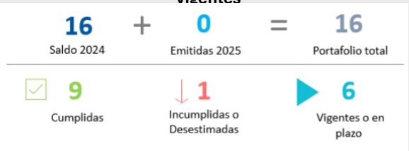
Figura 10. Recomendaciones externas vigentes

La administración de BN Vital registra el 56% de las recomendaciones externas cumplidas, el 38% en proceso dentro del plazo de atención y el 6% proceso fuera