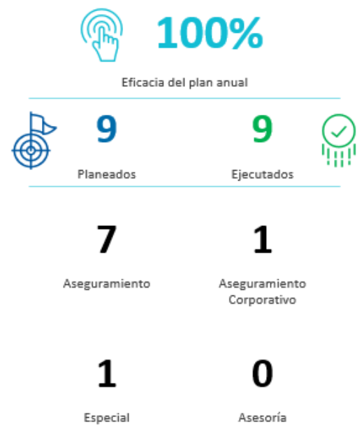
Figura 2. Eficacia del plan de aseguramiento

La Auditoría Interna realiza un estudio especial a la solicitud de la Junta Directiva, para el análisis de riesgos relevantes o emergentes, procesos o áreas críticas, y situaciones del entorno. El Anexo 1 enlista los estudios ejecutados.